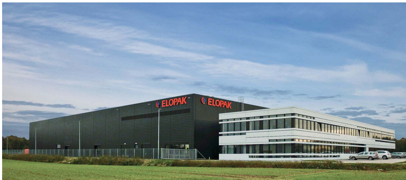
Am Standort Mönchengladbach entwickelt ELOPAK Abfüllanlagen für Getränkekartons.

„Als ich SAP PLM ECTR in einer Präsentation zuerst sah, war ich beeindruckt von der Masse der Informationen, die das System auf einen Blick zur Verfügung stellt“, erinnert sich René Wolters. Zu Beginn des Projektes hatte CIDEON ein SOLIDWORKS und EPLAN Starterpaket implementiert. In enger Zusammenarbeit mit dem Kunden erarbeitete das Unternehmen auf dieser Basis die Anforderungen für die erforderlichen projektspezifischen Erweiterungen und übernahm auch deren Implementierung.