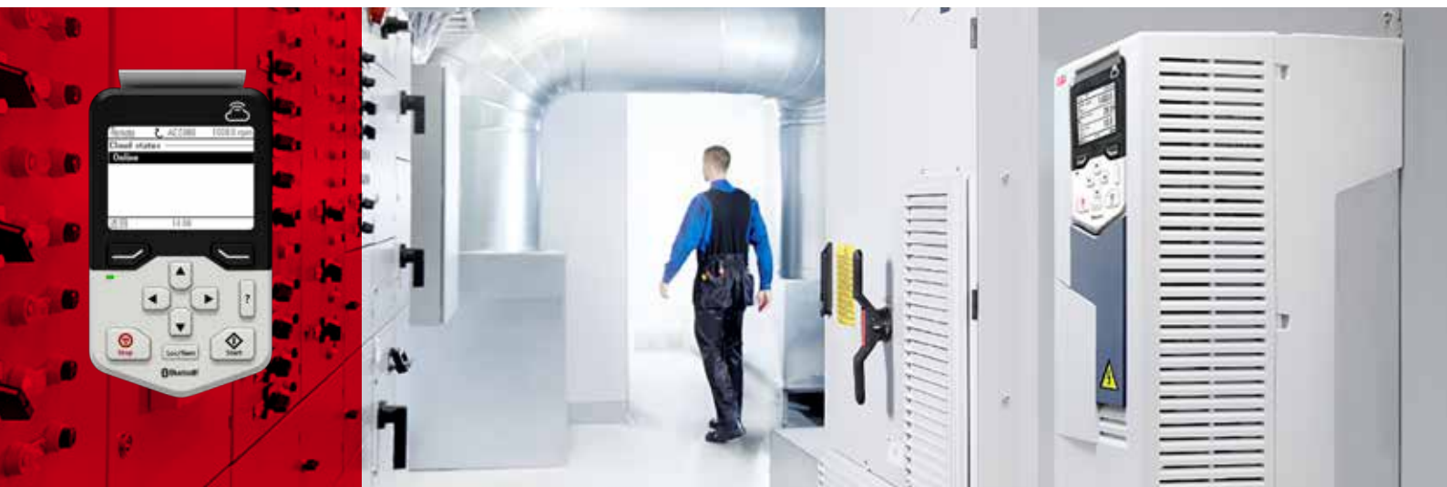
ABB Drive Connectivity Panel.

Für zenon sprach neben den umfangreichen Kommunikationseigenschaften auch die hohe Resilienz. Neben einer sehr guten Absicherung gegen Cybersecurity-Risiken war für die Salzburg AG vor allem die Möglichkeit eines autarken Betriebes der im Normalfall unbemannten Kraftwerke bei einem Serverausfall wichtig. Diese werden grundsätzlich mit der Möglichkeit zur örtlichen Bedienung und Beobachtung ausgestattet. „Während einige andere in Betracht gezogene Softwareprodukte auf einer Client-Server-Architektur basieren, ist zenon ein verteiltes System und beherrscht die stoßfreie Ringredundanz“, berichtet Schernthanner. „Das >>