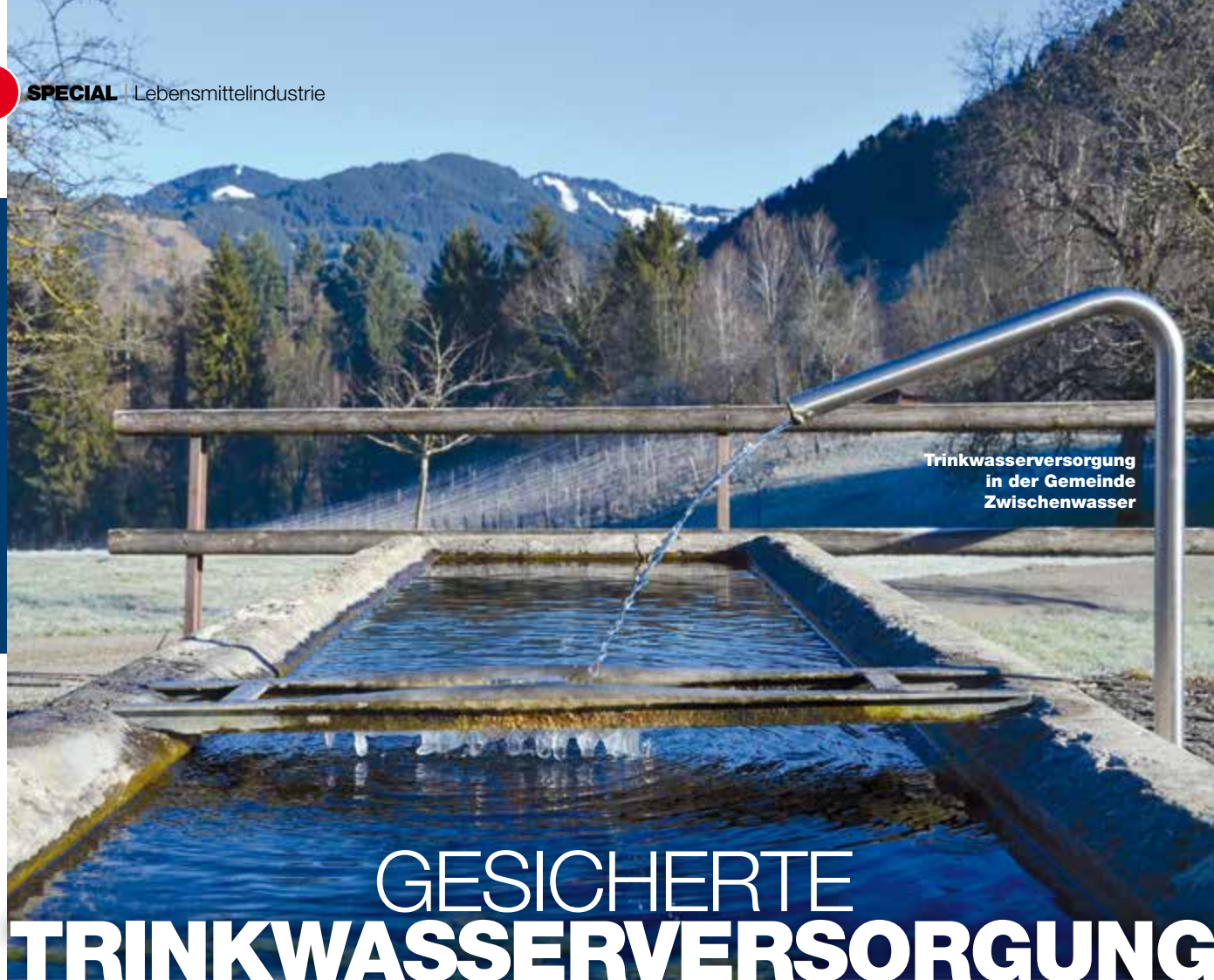
Trinkwasserversorgung in der Gemeinde Zwischenwasser