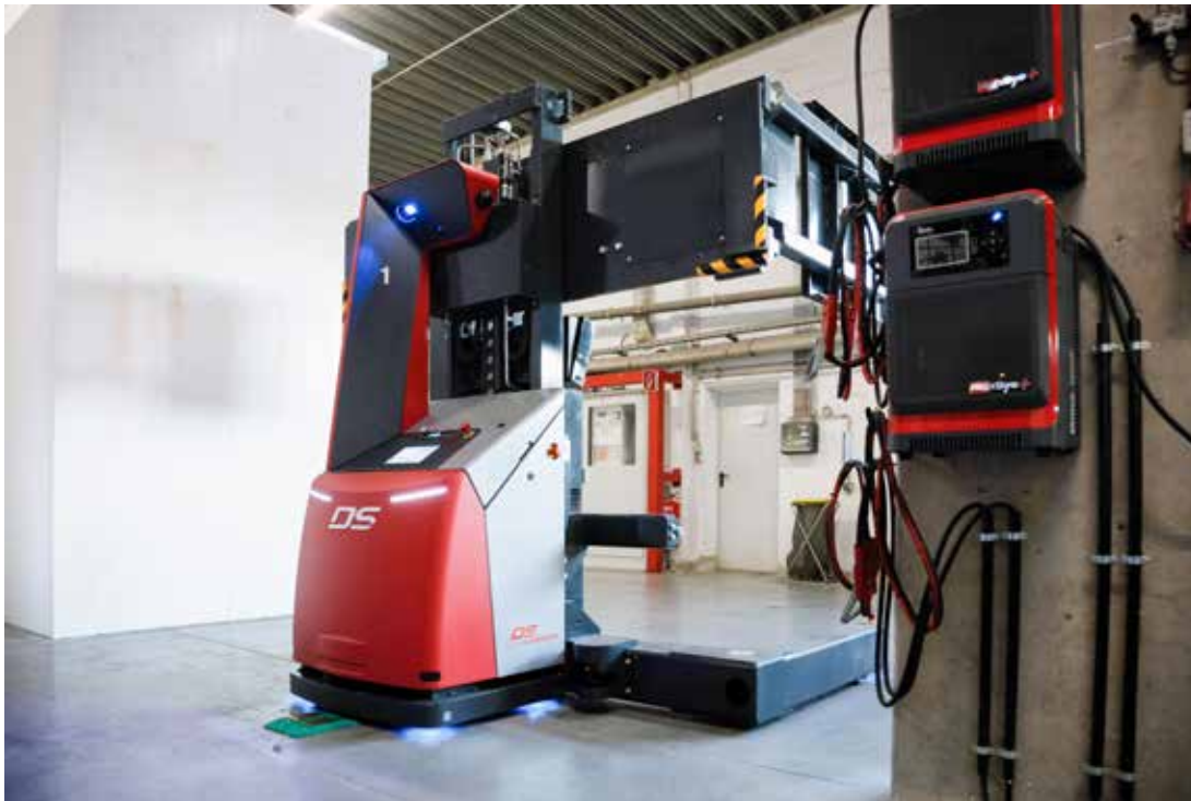
Die Ladepunkte, an denen die FTF ihre Bleigel-Akkus aufladen, sind im Gelände verteilt. So werden lange unproduktive Wege vermieden.

geistern. Zudem konnte die innerbetriebliche Transportkapazität wegen der begrenzten Gangflächen nicht beliebig erweitert werden. Auch die Lagerverwaltung mittels händisch geführter Listen war mit einem hohen Aufwand verbunden und behinderte die Optimierung der Produktionsplanung. Deshalb schlug Fraunhofer Austria Research als Kooperationspartner von Austrotherm für Logistik- und Produktionsmanagement vor, Transport und Lagerverwaltung der Schaumstoffblöcke zu automatisieren.