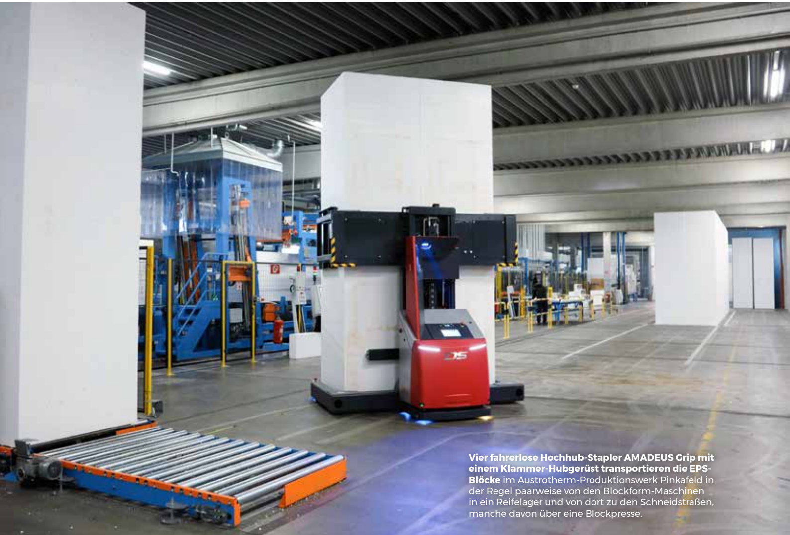
Vier fahrerlose Hochhub-Stapler AMADEUS Grip mit einem Klammer-Hubgerüst transportieren die EPS-Blöcke im Austrotherm-Produktionswerk Pinkafeld in der Regel paarweise von den Blockform-Maschinen in ein Reifelager und von dort zu den Schneidstraßen, manche davon über eine Blockpresse.