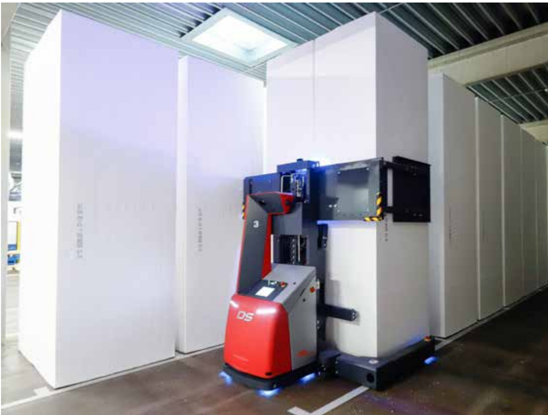
Die FTFS transportieren die Blöcke per freier Navigation mit punktueller Referenzierung in ein vom FTS verwaltetes Blocklager.