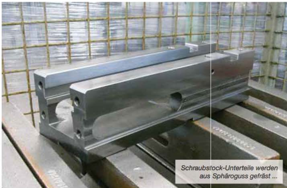
Schraubstock-Unterteile werden aus Sphäroguss gefräst ...