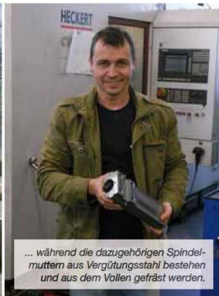
... während die dazugehörigen Spindelmuttern aus Vergütungsstahl bestehen und aus dem Vollen gefräst werden.