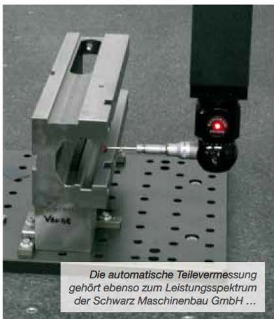
Die automatische Teilevermessung gehört ebenso zum Leistungsspektrum der Schwarz Maschinenbau GmbH ...