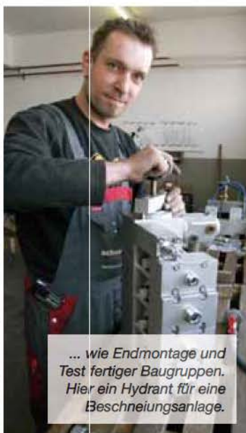
... wie Endmontage und Test fertiger Baugruppen. Hier ein Hydrant für eine Beschneigungsanlage.