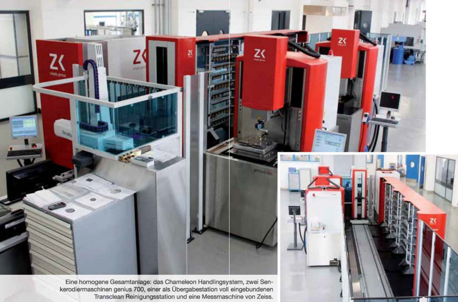
Eine homogene Gesamtanlage: das Chameleon Handlingsystem, zwei Senkerodiermaschinen genius 700, einer als Übergabestation voll eingebundenen Transclean Reinigungsstation und eine Messmaschine von Zeiss.