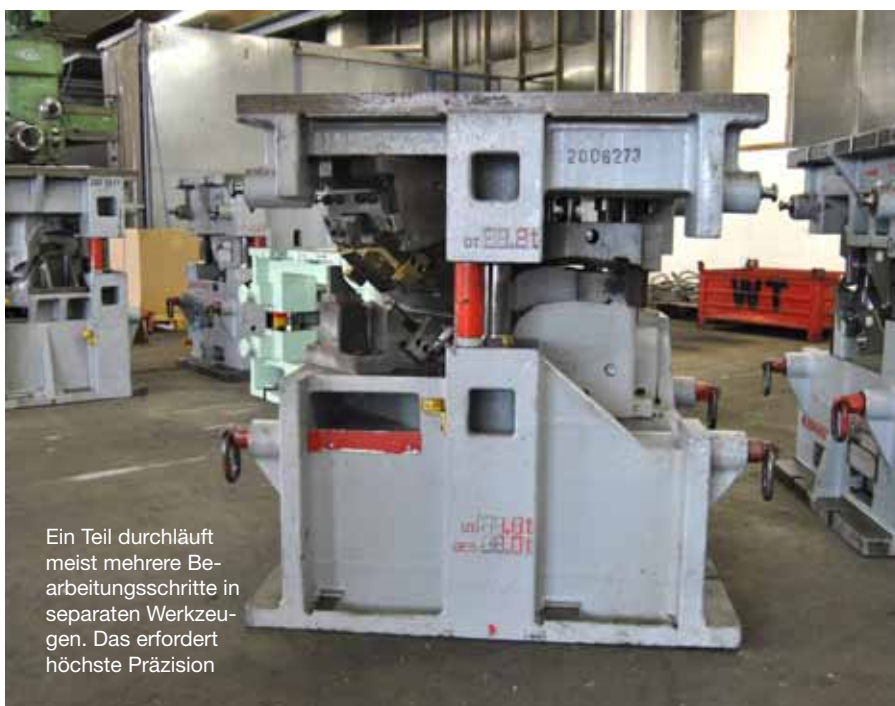
Ein Teil durchläuft meist mehrere Bearbeitungsschritte in separaten Werkzeugen. Das erfordert höchste Präzision

Vogel & Noot Technologie entschloss sich daher zur Anschaffung eines eigenen 3D-Messsystems. Die Entscheidung fiel zu Gunsten des ATOS Triple Scan. Bei dieser neuen Generation der mobilen 3D-Digitalisierer handelt es sich um eine komplette Neuentwicklung mit bislang einzigartiger Technologie. Die namensgebende Dreifach-Abtastungstechnologie sorgt insbesondere bei der Messung von glänzenden Oberflächen, feinen Strukturen und Kanten für eine nennenswerte Reduktion der Anzahl von Einzelscans. Das ist zum Teil darauf zurückzuführen, dass es im Gegensatz zu früheren Systemen nicht mehr zwingend erforderlich ist, dass die Geometrie von beiden Kameras zugleich erfasst wird. Mit der Verwendung von monochromatischem blauem LED-Licht als Referenz in der Blue Light Technology werden optische Umgebungseinflüsse ausgeschlossen. Der robuste und zugleich hochauflösende 3D-Scanner sorgt für die erforderliche Genauigkeit bei der Digitalisierung kleiner wie großer Objekte ohne