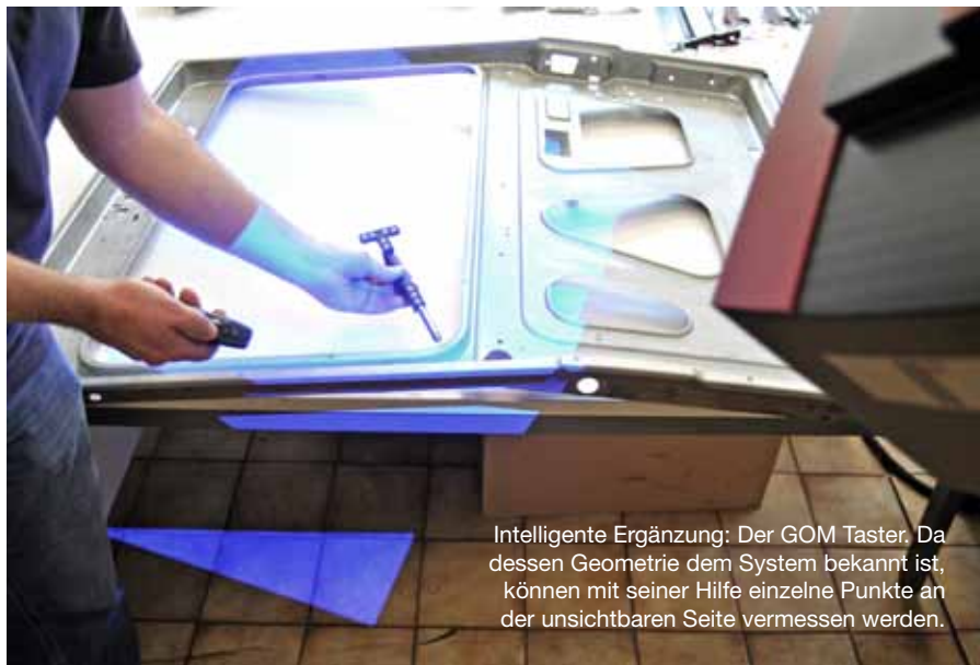
Intelligente Ergänzung: Der GOM Taster. Da dessen Geometrie dem System bekannt ist, können mit seiner Hilfe einzelne Punkte an der unsichtbaren Seite vermessen werden.

Da die Anschaffung solcher Systeme für viele Anwender mangels Häufigkeit des Bedarfes nicht wirtschaftlich wäre, bietet Westcam die 3D-Vermessung mittels ATOS 3D Scanner auch als Dienstleistung an. „Das war für uns die Möglichkeit, ohne