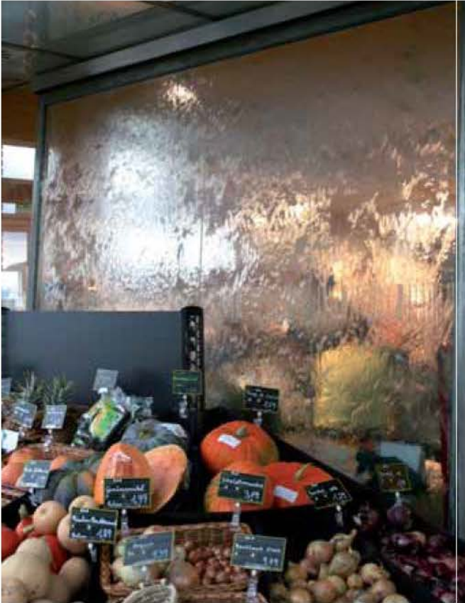
Frische Ware in freundlichem Klima: Die Wasserwand hinter dem Gemüsestand trägt zur Klimatisierung bei und ist in die Gebäudeautomation integriert.