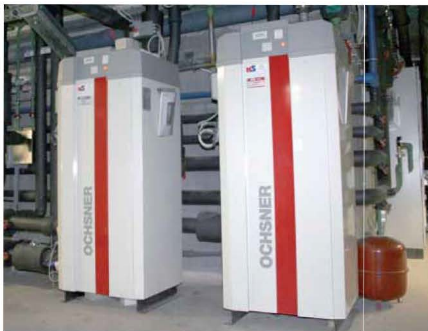
Zwei OCHSNER-Wärmepumpen der Typen OWWP46 und OWWP56 HK (technische Daten siehe Kasten) tragen die Hauptlast der Energieerzeugung.

Eigenständiges Lüften wird nach kurzer Zeit wieder eingestellt, wenn das Personal erkennt, dass dadurch nicht das Ergebnis zu erreichen ist, das die schnelle und „besser informierte“ Regelung schafft.