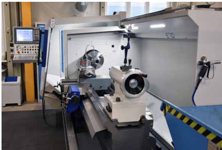
Der Arbeitsraum der Weiler E 70HD ist trotz kompromisloser Sicherheit durch überwachte Schutzhauben sehr gut zugänglich und übersichtlich.

men. Dabei müssen die angelieferten Komponenten teilweise überarbeitet werden, um Änderungen vorzunehmen oder die erforderliche hohe Passgenauigkeit herzustellen.