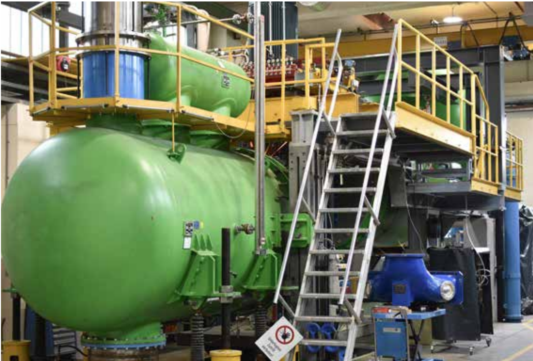
Im Prüfstand von Andritz Hydro am Standort Linz werden maßstäblich verkleinerte Turbinenmodelle unter realitätsnahen Bedingungen getestet.

Serviceleistungen für Wasserkraftwerke. Basierend auf 180 Jahren Erfahrung und einer weltweit installierten Leistung von 470 Gigawatt bietet das Unternehmen innovative Lösungen für Neubau und Modernisierung von Wasserkraftwerken jeder Größe. Modernste digitale Lösungen, umfassende Dienstleistungen für den Betrieb und die Wartung ganzer Wasserkraftwerke sowie Turbogeneratoren für die thermische Industrie runden das Portfolio ab.