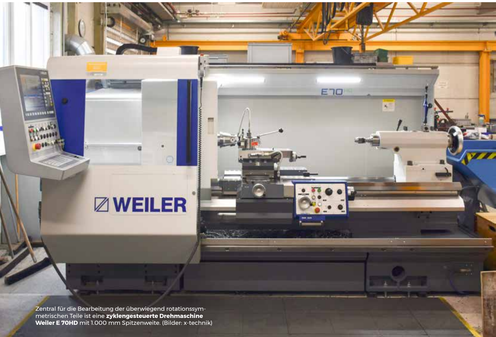
Zentral für die Bearbeitung der überwiegend rotationssymmetrischen Teile ist eine zyklengesteuerte Drehmaschine Weiler E 70HD mit 1.000 mm Spitzenweite.